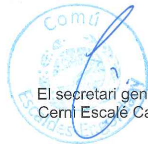
El secretari general Cerni Escalé Cabré